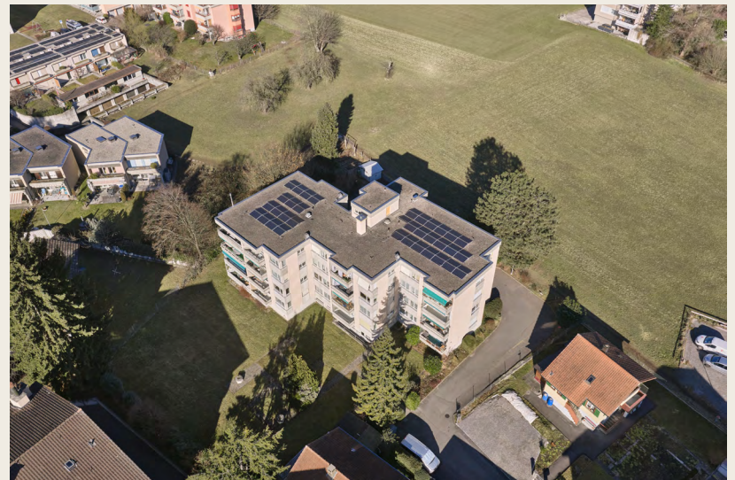
Aussenansichten mit Umgebung