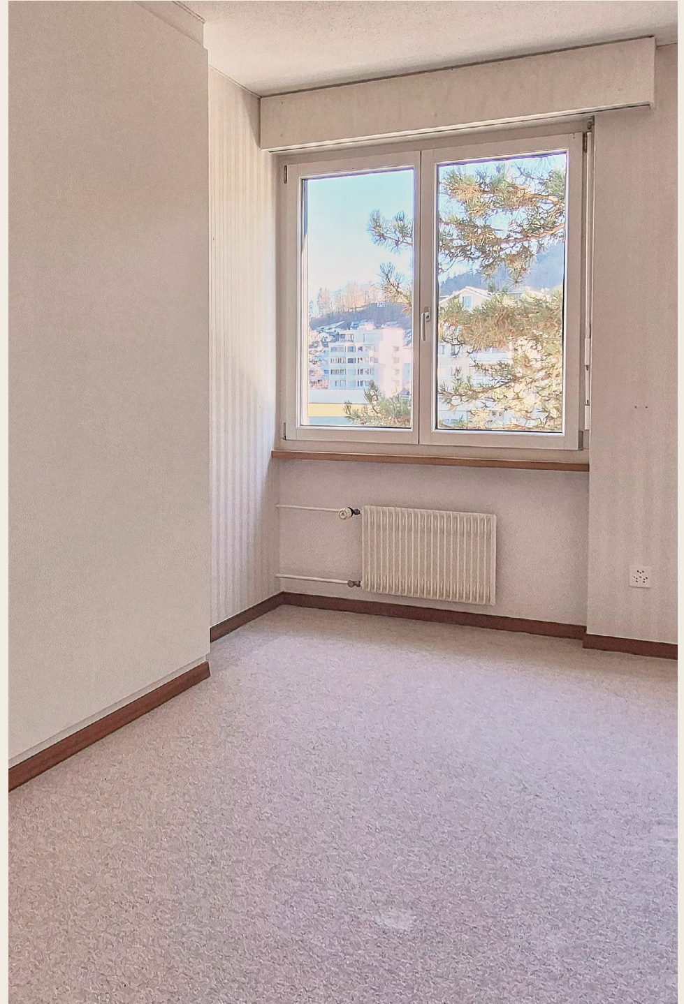
Küche, Wohnbereich, Zimmer